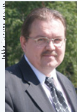
Jukka J rvinen arkisto

Kuka ja mist  olet? Millainen koulutus sinulla on?