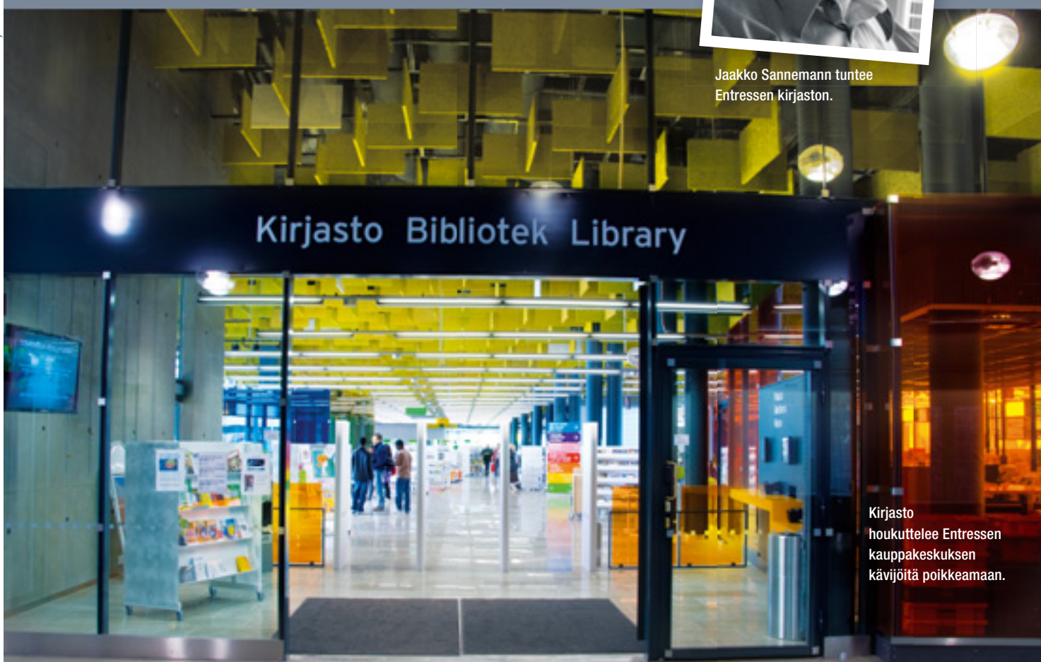
Kirjasto houkuttelee Entressen kauppakeskuksen kävijöitä poikkeamaan.