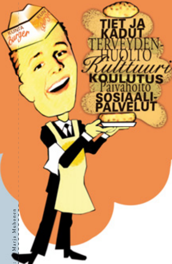
Piirros: Marja Muhonen