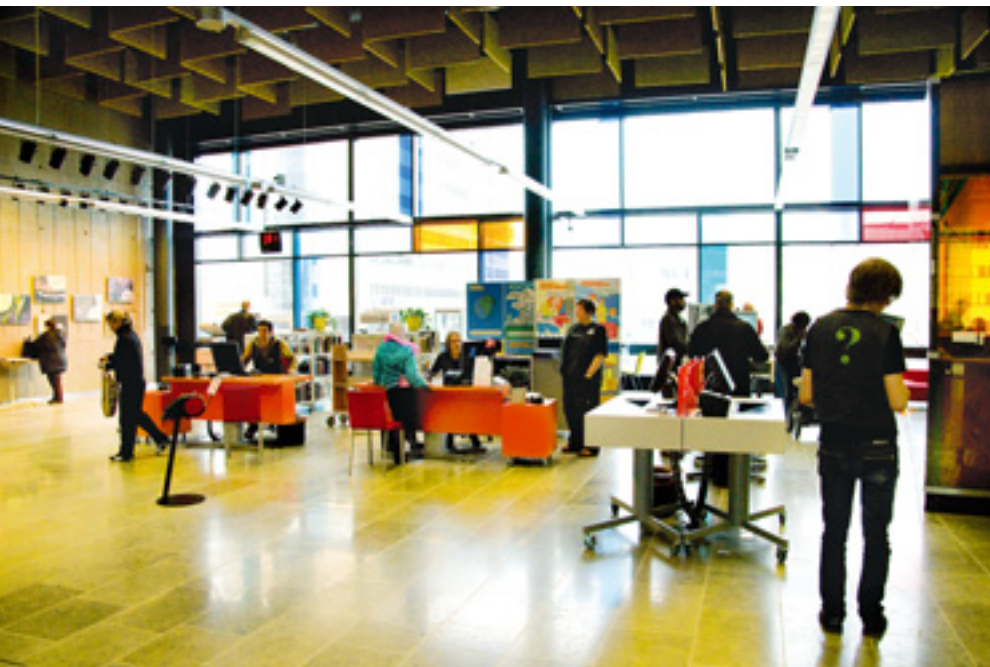
Entresen kirjaston infoaluetta.