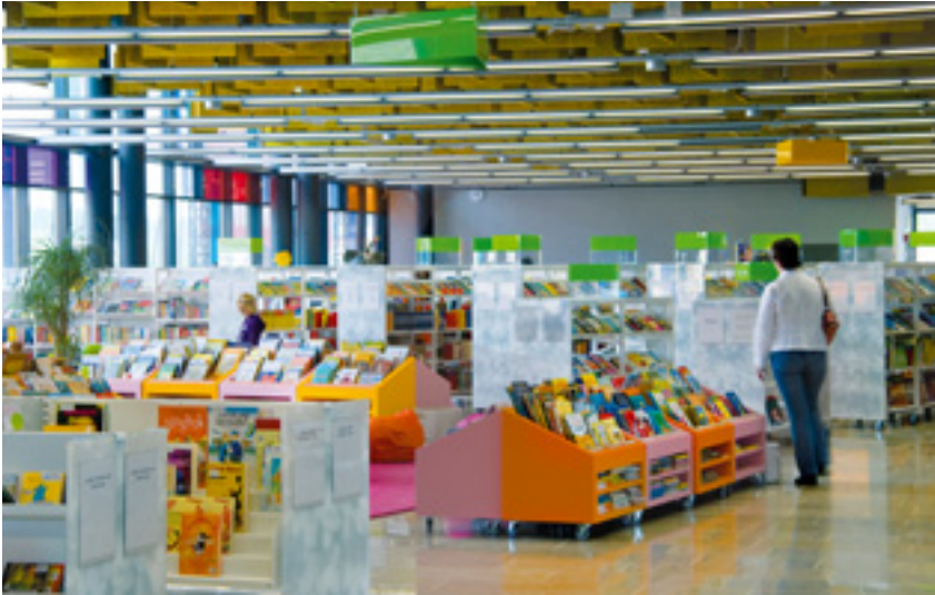
Entresen kirjaston lastenosasto on värikäs.