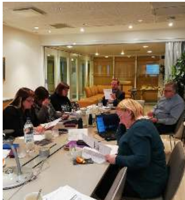
Akavan Erityisalojen kunnan neuvottelukunta on meille tärkeä edunvalvonnan vaikuttamispaikka

Akavan Erityisalojen kunnan neuvottelukunta on kattojärjestömme hallituksen alainen toimielin. Siellä kohtaavat eri jäsenyhdistysten kuntasektorin luottamushenkilöt koordinoitujen liiton kunta-alan edunvalvontaa. Viime kädessä kunnan neuvottelukunta tekee myös esitykset järjestöllisiin toimenpiteisiin ryhtymisestä. Neuvottelukunnan puheenjohtajuus on Kumulalla.