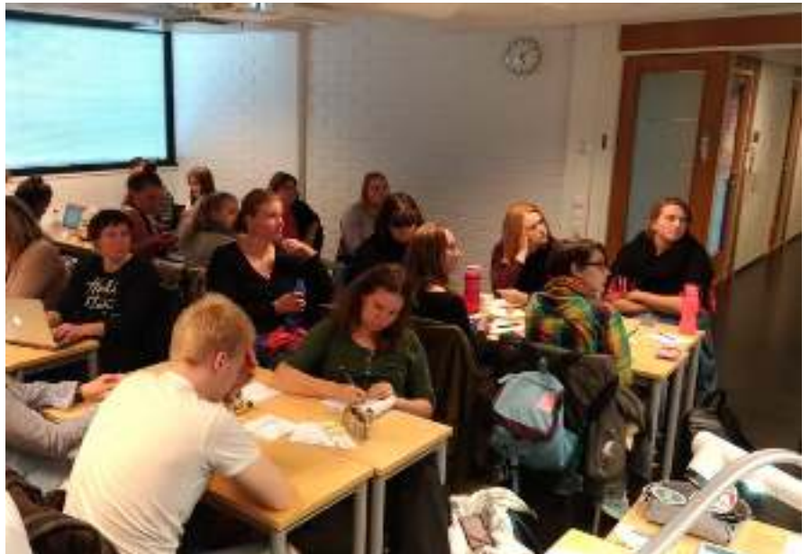
Hallat ry ja UDK ry piilotyöpaikkakoulutuksessa

Vuoden aikana järjestimme 15 opiskelijoiden koulutustilaisuuksia. Näiden lisäksi järjestimme vapaamuotoisempia tapahtumia kuten opiskelijakahveja ja tapaamisia. Tuimme myös vuosijuhlajärjestelyjä ja muuta opiskelijatoimintaa.