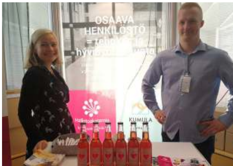
Kumulan Meeri ja Hallintoakatemia Kalle messupöhinässä

Nostimme Kuntamarkkinoilla keskusteluun kunta-alan henkilöstön osaamisen. Koulutusyrittäjä Hallintoakatemia kanssa aloitettu yhteistyö poiki kunta-alan koulutustarvekartoituksen, jonka perusteella löyettiin kättä päälle yhteisestä messuosallistumisesta. Messuilla jaettu kotimainen punaherukoista valmistettu Kuntalimonadi oli jymymenestys, jota tultiin kiittelemään useaan otteeseen. Saimme uusia jäseniä, teimme itseämme tunnetuksi ja saimme välitettyä meille tärkeän viestin eteenpäin: Kunnissa on osaamista, mutta myös osaamistarpeita, jotka pitää huomioida. Erityisesti kaivattiin sosiaalisen median ja viestinnän koulutusta.