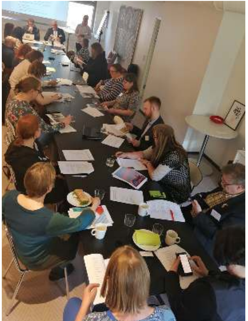
Kumulan liittovaltuuston kevätkokous 2019 käynnissä.

Kevätkokouksessaan huhtikuussa 2019 liittovaltuusto hyväksyi sääntömuutosesityksen. Sääntömuutos astui voimaan kesäkuussa 2019, jolloin myös liittovaltuusto lakkasi olemasta. Ensimmäinen syyskokous pidettiin marraskuun 23. päivänä. Jatkossa jokainen jäsen voi siis osallistua Kumulan päätöksentekoon.