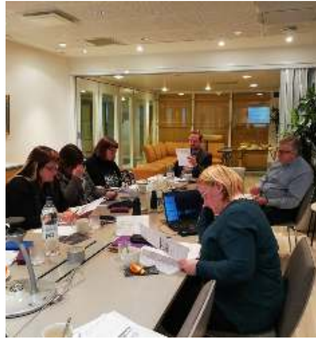
Akavan Erityisalojen kunnan neuvottelukunta on meille tärkeä edunvalvonnan vaikuttamispaikka

Akavan Erityisalojen kunnan neuvottelukunta on kattojärjestömme hallituksen alainen toimielin. Siellä kohtaavat eri jäsenyhdistysten kuntasektorin luottamushenkilöt koordinoiden liiton kunta-alan edunvalvontaa. Viime kädessä kunnan neuvottelukunta tekee myös esitykset järjestöllisiin toimenpiteisiin ryhtymisestä. Neuvottelukunnan puheenjohtajuus on Kumulalla.